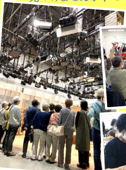
テレビ局スタジオ見学

仲間と一緒にいろいろなことにチャレンジしながら、新しいことに会い、自分の楽しみを見つけませんか? コミュニティセンターなど区内8会場で行っています。