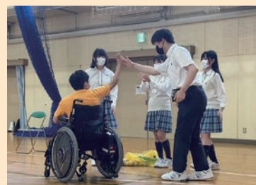
シュートが決まりハイタッチする講師と生徒