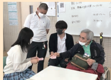
トランプでの交流