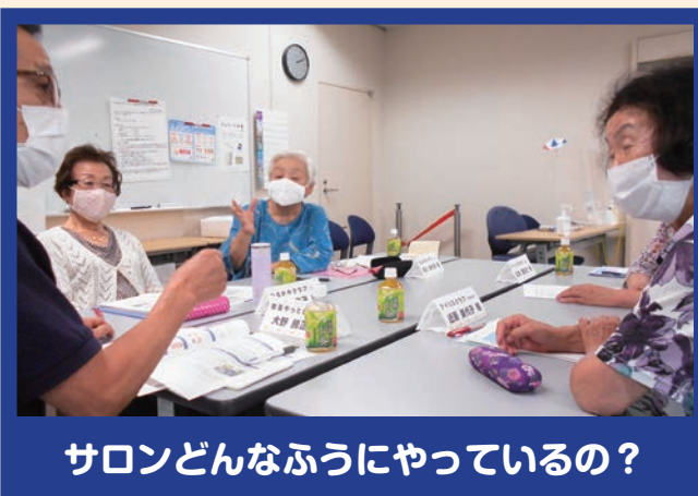
サロンどんなふうに行っているの？