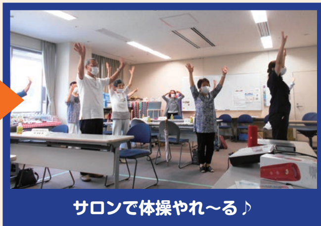
サロンで体操やれ〜る♪