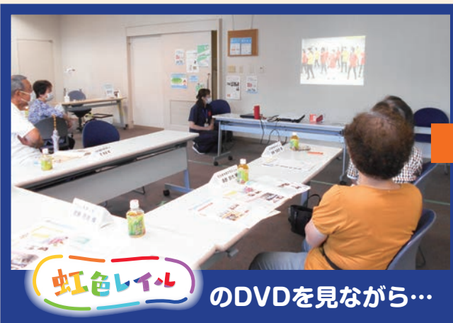
虹色レイルのDVDを見ながら…