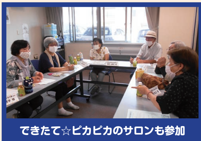
できたて☆ピカピカのサロンも参加