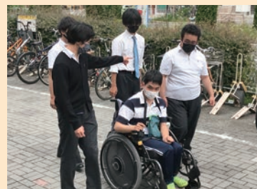
学校周辺を車いすで走行したり講師と一緒に歩く