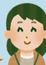
センター 社会福祉士

民生委員と一緒に自宅を訪問し、電話での安否確認には了承されたので、週一回の見守り電話がスタートしました。Aさんは次第に電話スタッフを信頼し、介護保険を使ってみようかな…と言われるようになりました。