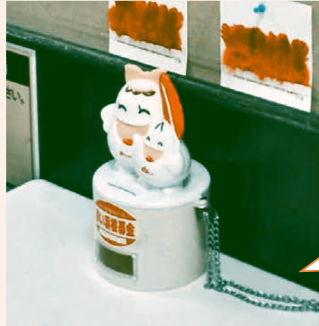
▲赤い羽根共同募金協力店区内 計71カ所に募金箱を設置! 募金合計186,659円