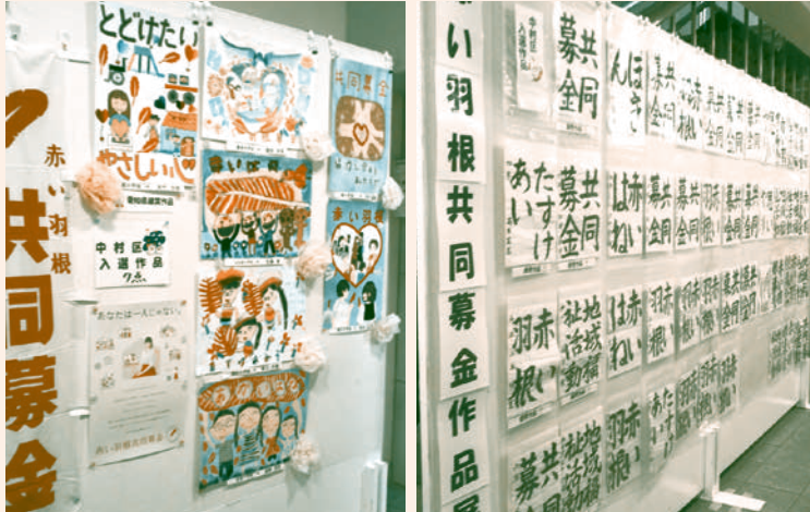
▲赤い羽根作品コンクール展示 区内小中学生の作品が運動をPR! 計22校1,012点応募