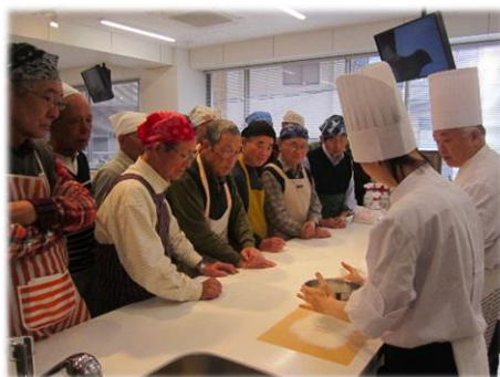
～おやじのスイーツ作り講座～